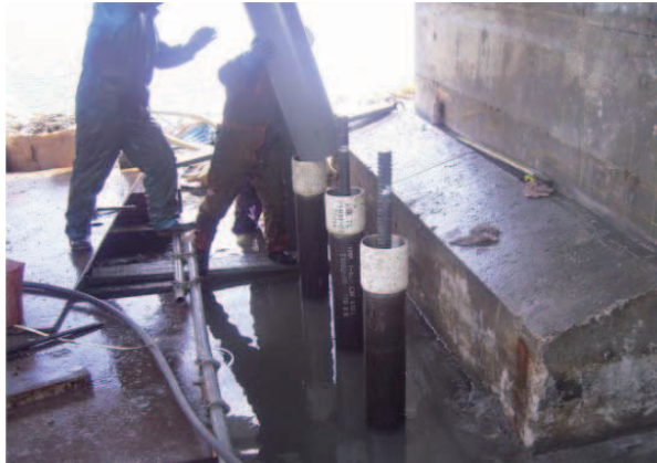
防護塩ビ管配置状況