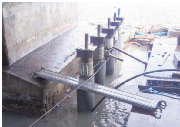
杭頭鋼管取付状況