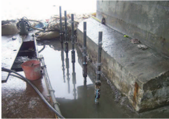
最上部芯鉄筋接続状況