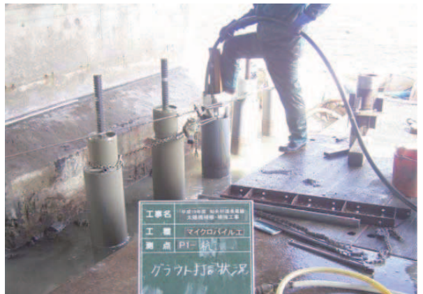
グラウト充填状況