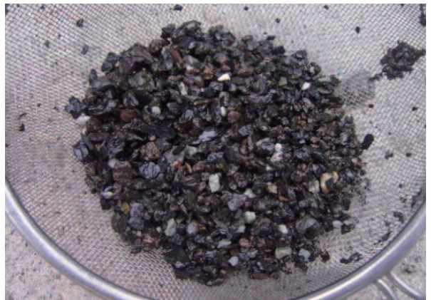
採取土質サンプル