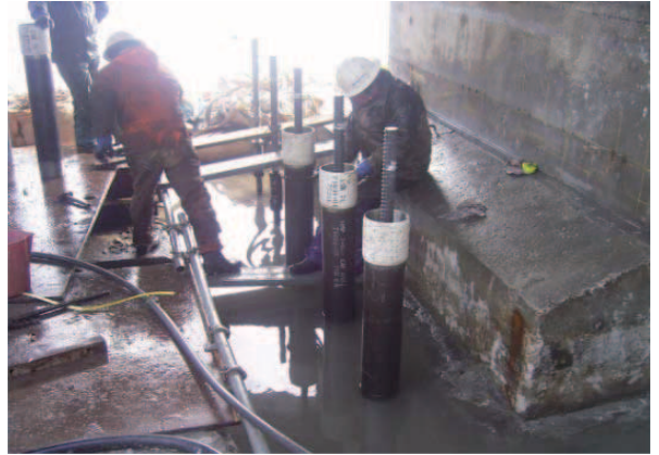
最上部鋼管接続状況