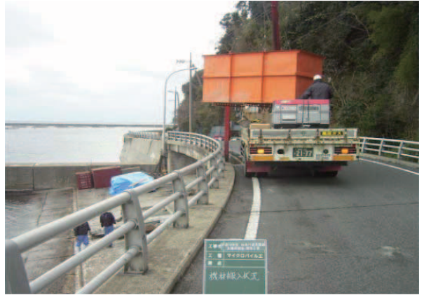
プラント材搬入状況